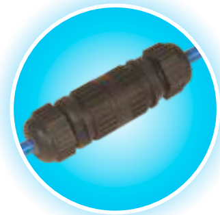
Conexión rápida en línea