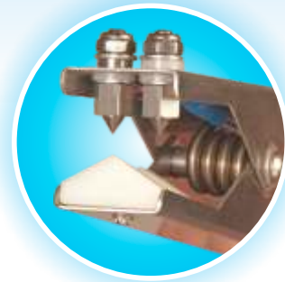
Puntas de carbono de tungstenoide