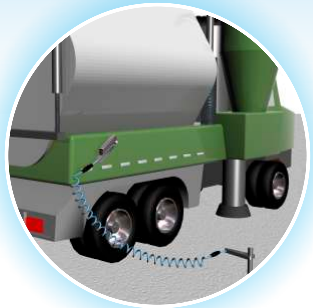
Conexión equipotencial de un camión cisterna aspirante a una pica de tierra